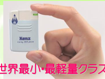
世界最小・最軽量クラス

携帯型心電図を24時間装着し、日常生活上の心電図波形や脈拍を記録して分析します。不整脈の出現や、狭心症が疑われるときに行います。